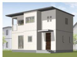
*写真は完成イメージベースです。

鉄骨住宅 SmartPowerStation-Urban [スマートパワーステーション アーバン]