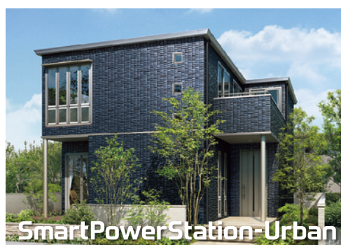
*写真は同タイプの商品ですが実際の建物とは異なります。