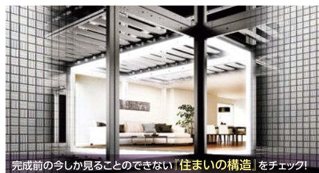
完成前の今しか見ることのできない「住まいの構造」をチェック!