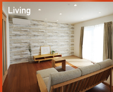
Living 広々リビングにはタミコーナーを設置。家族でコロンとお昼寝したり、洗濯物をたたむスペースとしても使えます。