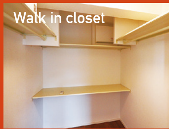
Walk in closet 主寝室のW.I.C.は、布団もスーツケースもしまえる大容量。