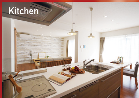
Kitchen キッチンからはLDKを見渡せ、作業しながらもダイニングでお勉強するお子様や、リビングで寛ぐご家族を見守ることができます。