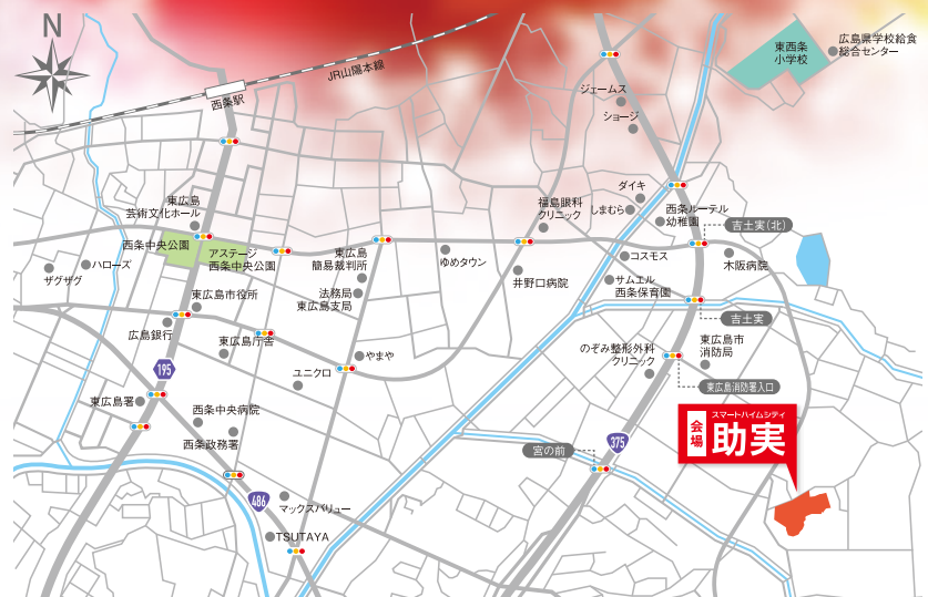
※「マップコード」および「MAPCODE」は(株)デンソーの登録商標です。※カーナビの機種によってはマップコードに対応していない場合があります。

「スマートハイムシティ助実」が立地する西条町は、人口増加が続く東広島の中でも、特に都市化が進み市の活力を牽引するエリア。緑の山並みを後背にひかえた豊かな自然に包まれた地でありながら、JR「西条」駅周辺の都市機能が整った中心市街地へ歩いていく利便性は、生活するにあたって大きな価値と言えるでしょう。