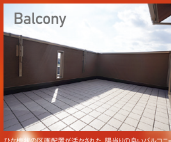
Balcony ひな植栽の区画配置が活かされた、陽当りの良いバルコニー。