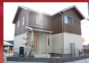
★写真は実際の建物を撮影したものです。(2019.11月撮影)