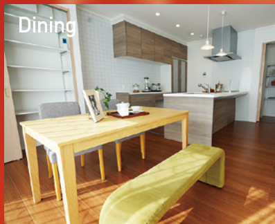
Dining 大きな窓の横のダイニング。朝日が降り注ぐダイニングで朝食を楽しましませう。