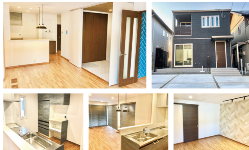
★実際の建物を撮影した写真です。(2020年5月1日撮影)