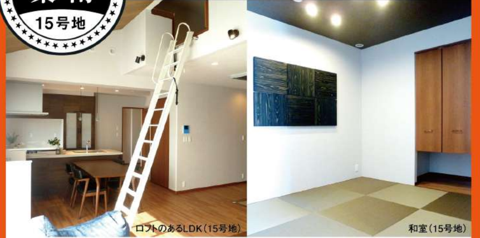
ロフトのあるLDK(15号地) 和室(15号地)