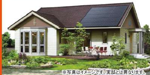
※写真はイメージです。実際とは異なります。