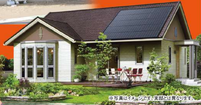
※写真はイメージです。実部とは異なります。