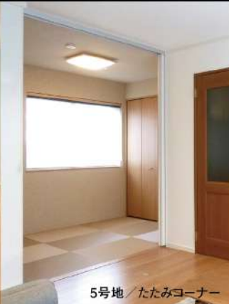
5号地 / たたみコーナー