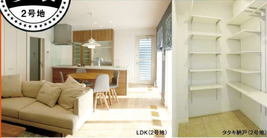
LDK(2号地) タタキ納戸(2号地)