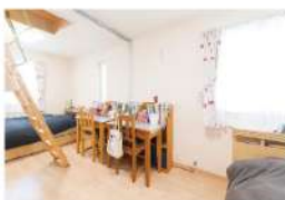
1号地 / 子ども室 (イメージ)