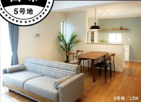
5号地 / LDK