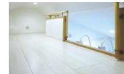
5号地 / ロフト

西側の子ども室に設けたロフトは、 成長とともに増えていく子ども達の 荷物の収納など多目的に使えます。