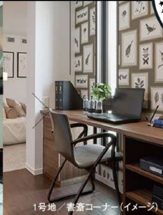
1号地 / 書斎コーナー (イメージ)