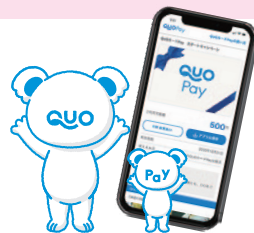
※イラストはイメージです。

※他の特典との併用はできません。※来場時アンケートにご記入いただいたご家族に、一家族につき1回プレゼント。 ※クオ・カードペイのお届けは、ご来場いただいた月の翌月中旬頃となります。詳しくはスタッフにお問い合わせください。