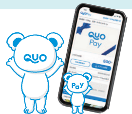
※イラストはイメージです。

※他の特典との併用はできません。※来場時アンケートにご記入いただいたご家族に、一家族につき1回プレゼント。 ※クオ・カードペイのお届けは、ご来場いただいた月の翌月中旬頃となります。詳しくはスタッフにお問い合わせください。