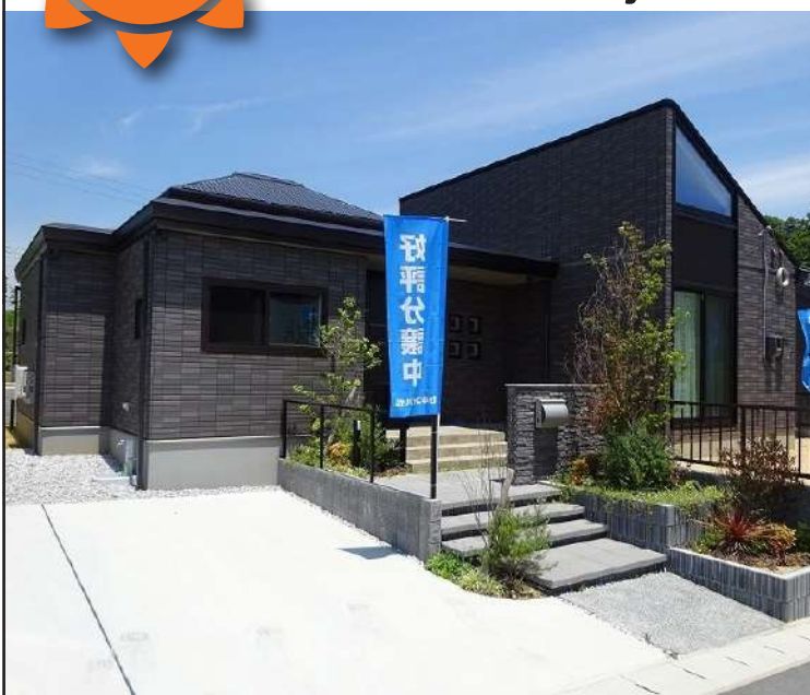
あすとぴあ35号地外観(2021年5月撮影)