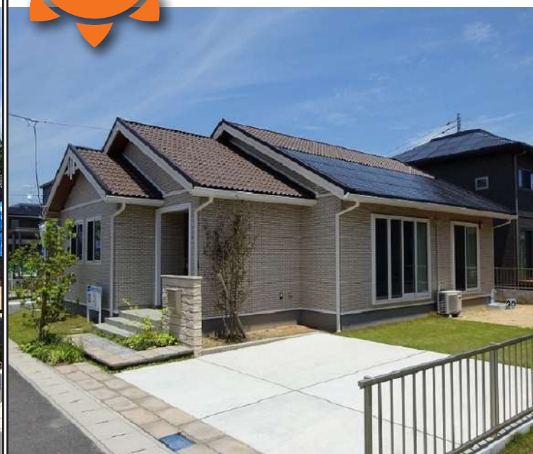
エコタウンときわ54号地外観(2021年5月撮影)