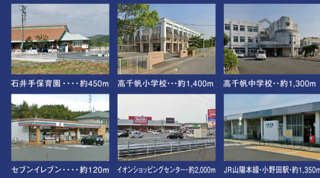
石井手保育園...約450m 高千帆小学校...約1,400m 高千帆中学校...約1,300m セブンイレブン...約120m イオンショッピングセンター...約2,000m JR山陽本線・小野田駅...約1,350m

停止条件付宅地販売 当広告の土地は土地売買契約締結後3ヶ月以内にセキスイハイム中四国株式会社と住宅の建築請負契約を締結していただくことを条件として販売いたします。この期間内に住宅を建築しないことが確定したとき、または住宅の建築請負契約が成立しなかった場合は、土地売買契約は白紙となり受領した金額は全額無利息でお返しいたします。