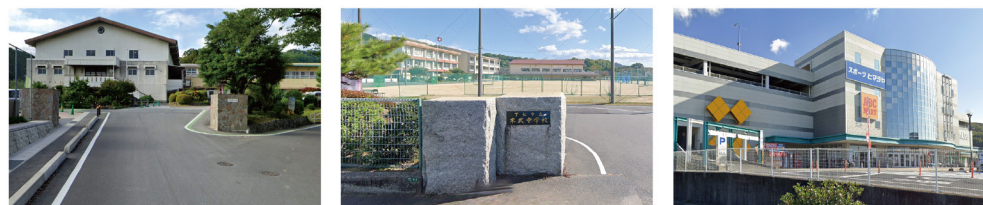
下松市立花岡小学校…約1,200m 下松市立末武中学校…約1,100m サンリブ下松店…約450m