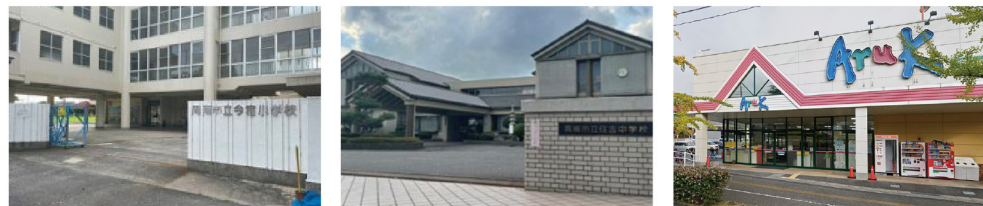
周南市立今宿小学校…約800m 周南市立住吉中学校…約450m アルク徳山中央店…約700m