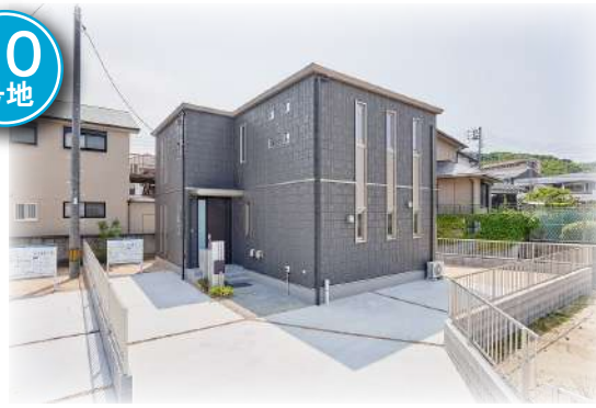
生野町10号地 (2021年6月撮影)