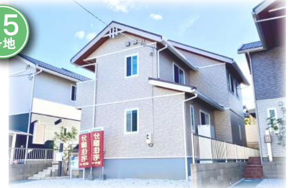
一の宮15号地 (2021年10月撮影)