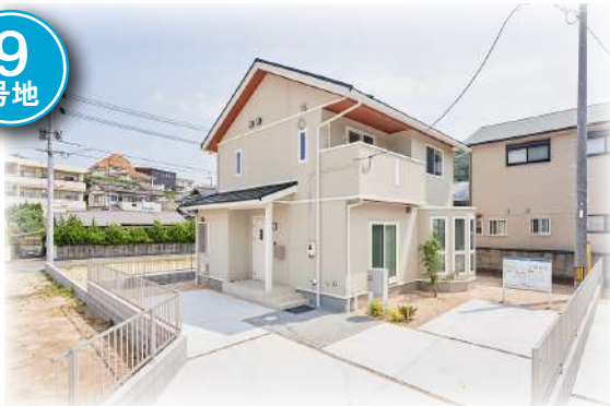
生野町9号地 (2021年6月撮影)