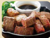
国産黒毛和牛 角切りステーキ