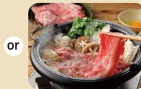
岡山県産「備前牛」 すき焼き260g