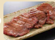
べこ政宗 厚切り牛たん 塩味