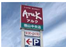
アルク徳山中央店...約700m