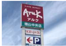
アルク徳山中央店...約700m