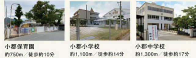
小郡保育園 約750m/徒歩約10分 小郡小学校 約1,100m/徒歩約14分 小郡中学校 約1,300m/徒歩約17分