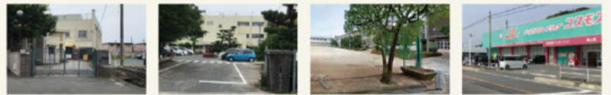
華城保育園 約900m/徒歩約112分 華城小学校 約1,300m/徒歩約17分 桑山中学校 約1,000m/徒歩約13分 コスモス桑山店 約400m/徒歩約5分