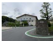
花岡小学校まで約1200m