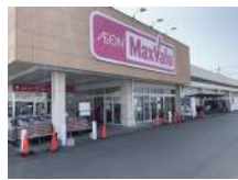
マックスバリュまで約300m