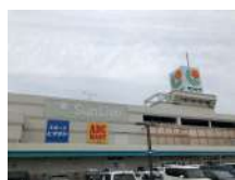
サンリボ下松まで約450m