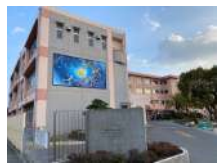
公集小学校まで約1300m