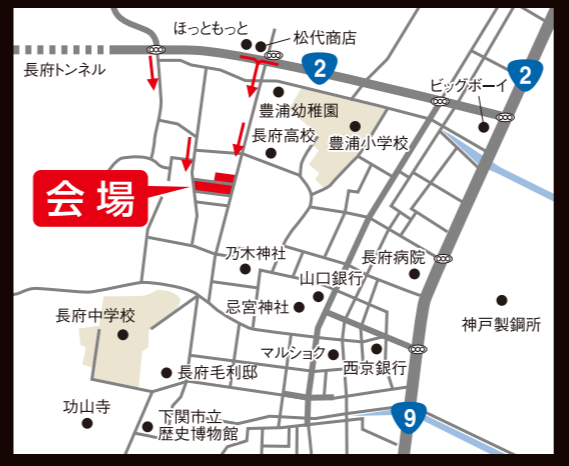
※「マップコード」および「MAPCODE」は(株)デンソーの登録商標です。