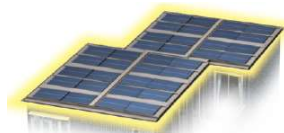
太陽光発電システム

太陽光発電や蓄電池による、 買う電力だけに頼らない暮らし。 電気代上昇のリスクを軽減します※1