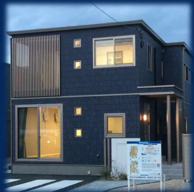
【外観・内観写真（2021年4月撮影）】