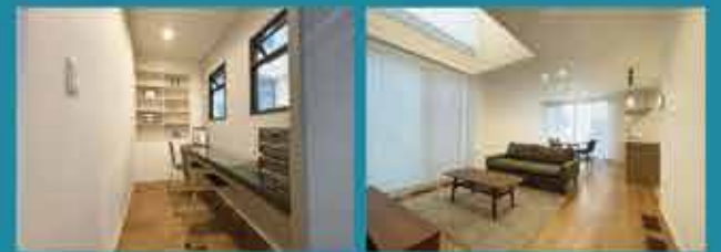
※完成予想パース ※内観写真(2023年3月撮影)

【物件概要】●販売価格/51,304,000円(消費税10%込)●所在地/松江市西津田9丁目1438-53●販売戸数/1戸●構造/軽量鉄骨2階建●間取り/3LDK●地目/宅地●都市計画/市街化区域●交通/松江市営バス「開運稲荷前」バス停900m(徒歩12分)●用途地域/第二種中高層住居専用地域●建ぺい率/60%●容積率/200%●道路の幅員/東側6.0m(公道)※私道負担なし●主な設備/○電気:中国電力○水道:公営水道○雨水:側溝○排水:公共下水道●その他の制限/○建築基準法第22条区域○松江市景観地区○土砂災害警戒区域に一部入ります。●建築年月日/2023年1月30日●取引形態/○建物:売主○土地:売主