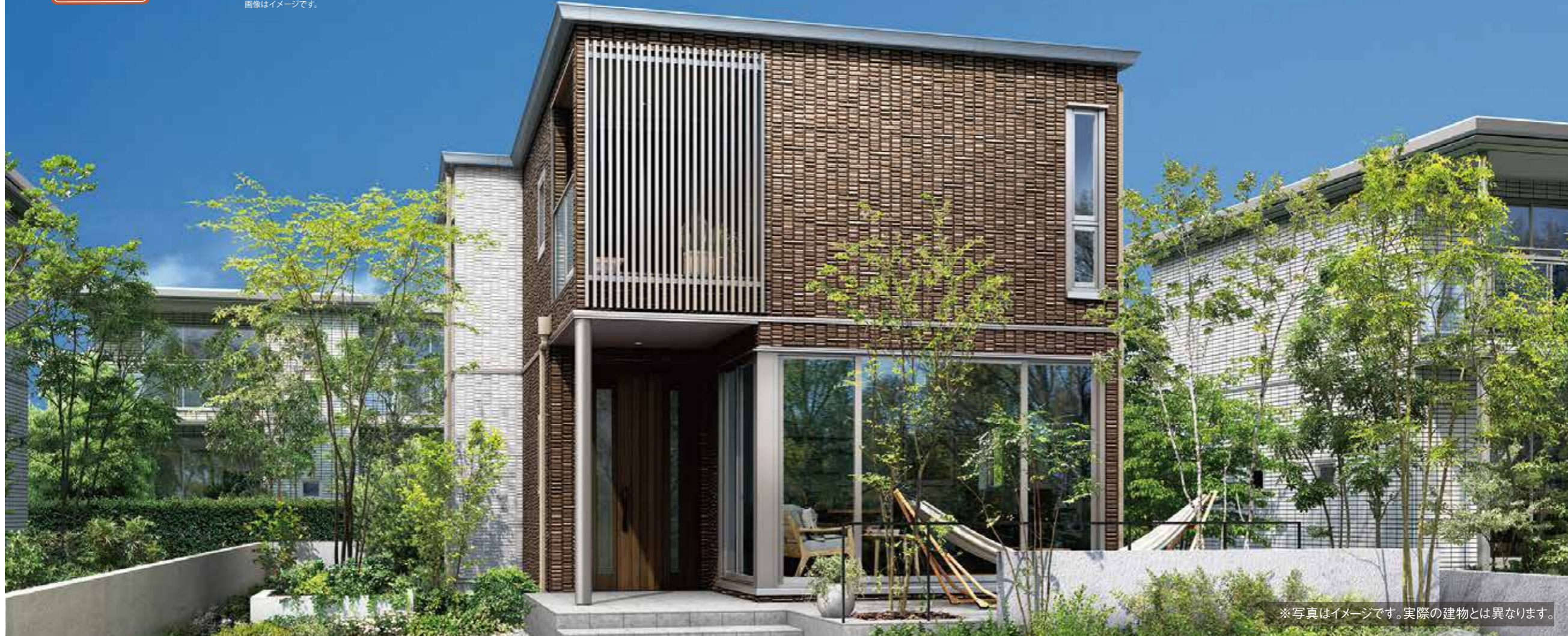
※写真はイメージです。実際の建物とは異なります。