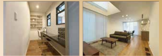
※内観写真(2023年3月撮影)

■1F床面積/55.21㎡ ■2F床面積/49.96㎡ ■延床面積/105.17㎡(31.81坪) ■土地面積/202.17㎡(61.15坪)