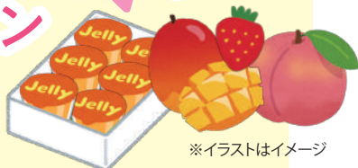
※イラストはイメージ

※アンケートにご記入ください。 ※1家族様につきお1つ、1回限り とさせていただきます。