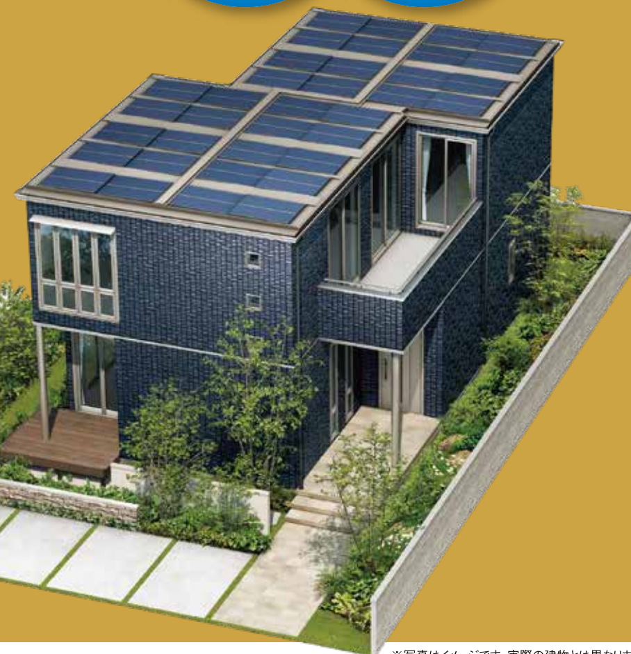
※写真はイメージです。実際の建物とは異なります。