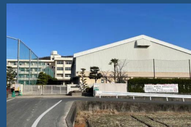
岡山市立高島中学校 徒歩25分～26分 <2,000～2,080m>