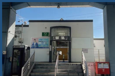
JR山陽本線・赤穂線「高島」駅 徒歩16分～17分 <1,210～1,290m>