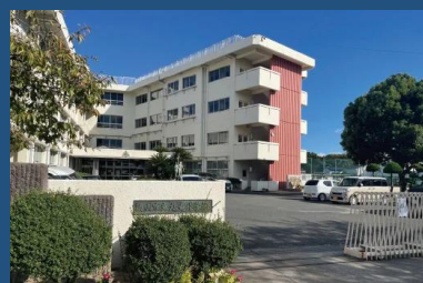
岡山市立旭竜小学校 徒歩6分～7分 <420～540m>