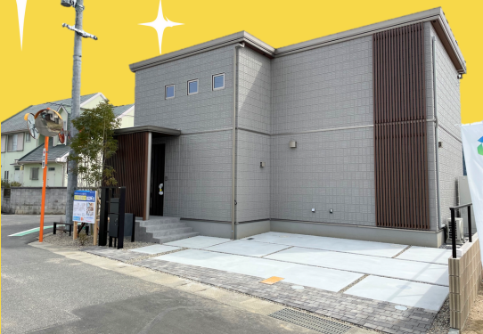
4号地外観写真撮影日/2024年4月1日