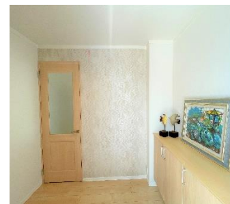
○写真撮影日 : 2023年7月23日