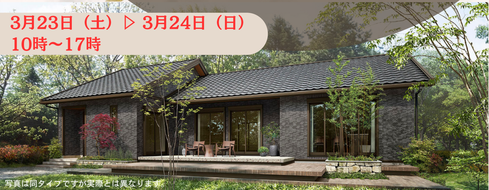
写真は同タイプですが実際とは異なります。