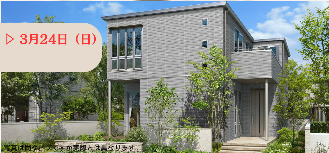
写真は同タイプですが実際とは異なります。