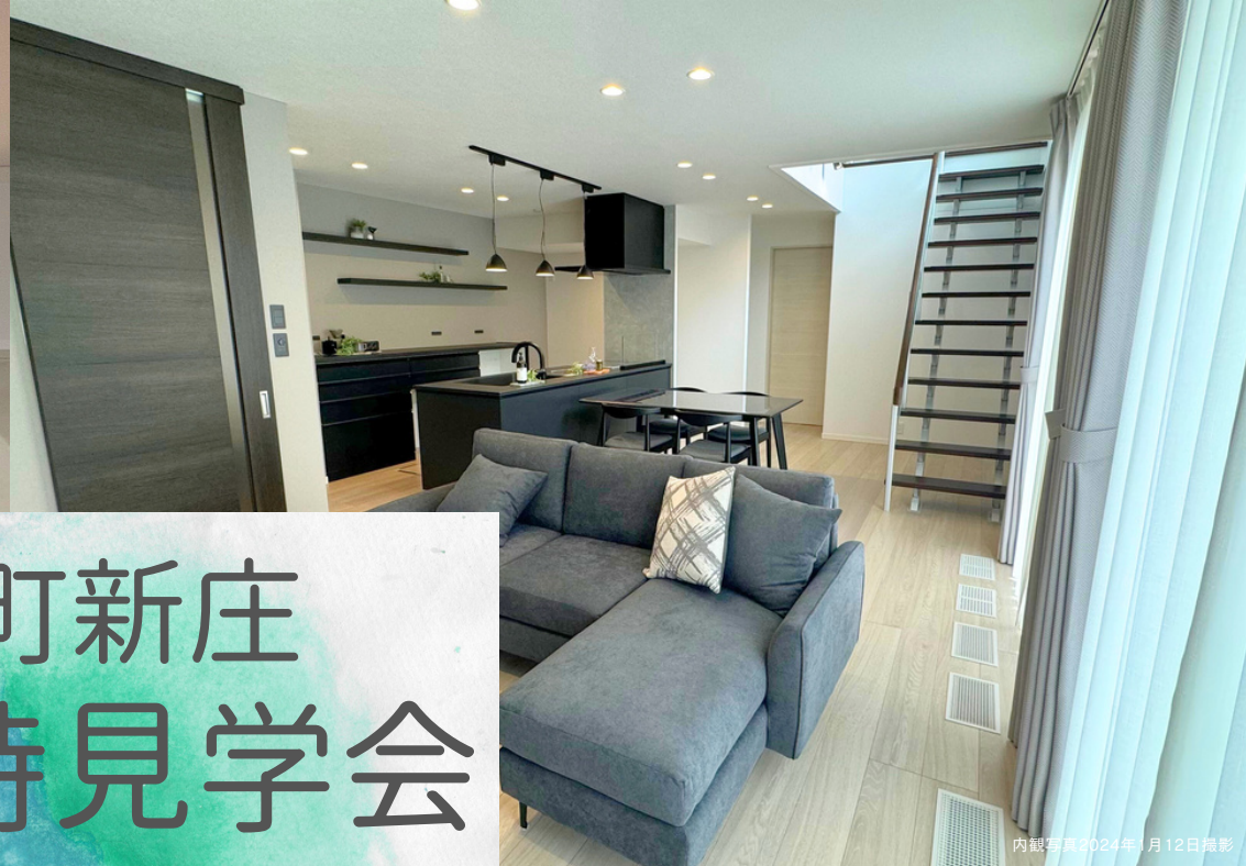
内観写真2024年1月12日撮影