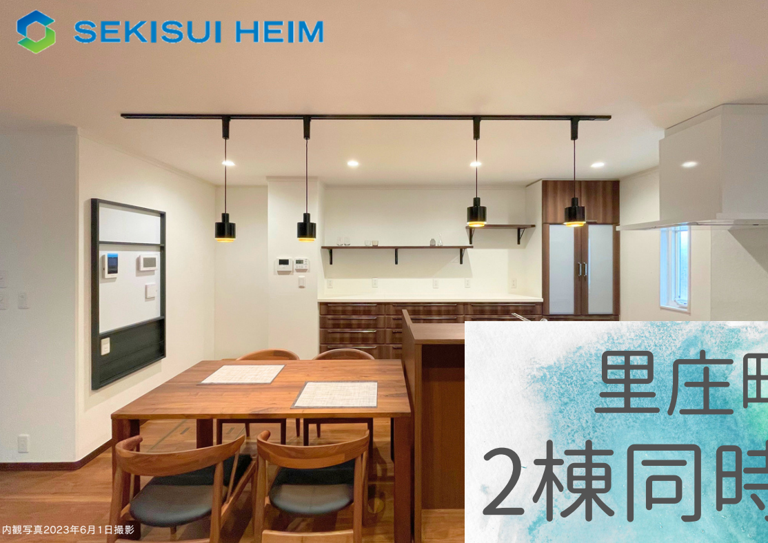
内観写真2023年6月1日撮影