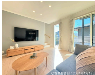
○写真撮影日：2024年1月12日