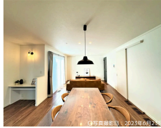
○写真撮影日：2023年6月23日