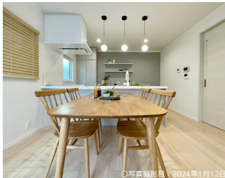
○写真撮影日：2024年1月12日