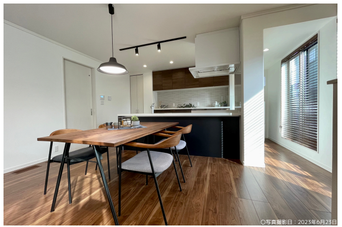
○写真撮影日：2023年6月23日