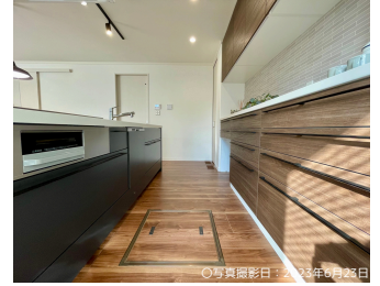
○写真撮影日：2023年6月23日