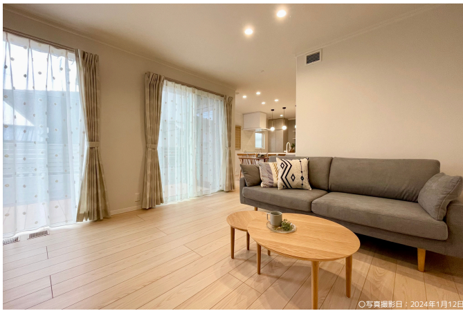
○写真撮影日：2024年1月12日