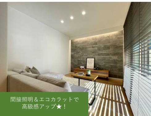
間接照明&エコカラットで 高級感アップ★!