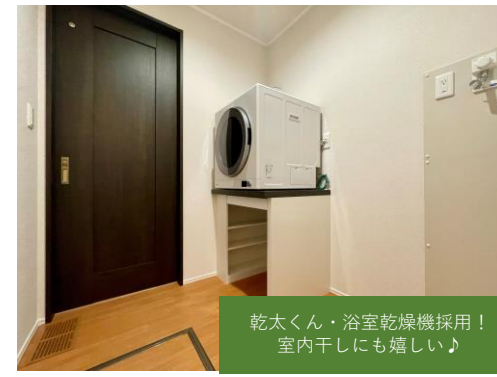
乾太くん・浴室乾燥機採用! 室内干しにも嬉しい♪

【物件概要】 ●所在地/倉敷市連島一丁目3番44, 3番49 ●販売戸数/1戸 ●構造/軽量鉄骨造2階建 ●間取り/3LDK ●販売価格/53,900,000円(消費税10%込) ●地目/宅地 ●都市計画/市街化区域 ●用途地域/第二種住居地域 ●建ぺい率/60% ●容積率/200% ●道路の幅員/北側5.8m(倉敷市道) ●主な設備/〇電気:中国電力〇ガス:都市ガス〇水道:公営水道〇雨水:側溝〇排水:公共下水道 ●その他の制限/〇法第22条区域〇倉敷市景観条例〇水島第二島島土地区画整理事業 ●建築年月/2025年1月完成 ●取引態様/〇建物:売主〇土地:売主 ●備考/〇ゴミステーションは、東側方面で用水路上にあります。町内会入会が条件となります。〇3号地の北東部分の上空に電線が通っています。変更はできません。〇まちなみデザインガイドラインがあります。