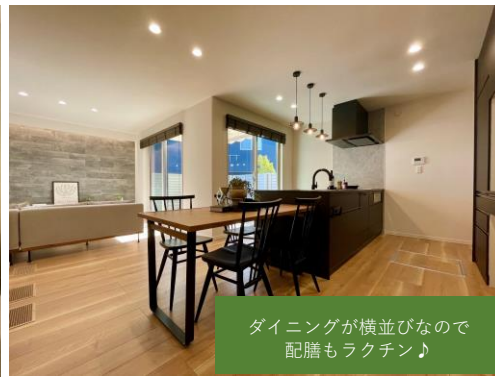
ダイニングが横並びなので 配膳もラクチン♪