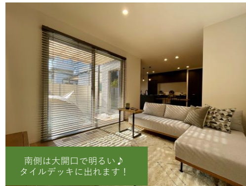
南側は大開口で明るい♪ タイルデッキに出れます!