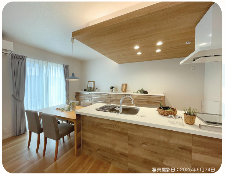
写真撮影日: 2025年6月24日

●所在地/岡山市東区瀬戸町江尻1192番10 ●建築確認番号/第ERI-25003393 < 令和7年2月5日 > ●販売戸数/1戸 ●構造/木造2階建 ●間取り/3LDK ●販売価格/51,800,000円 (消費税10%込) ●地目/宅地 ●都市計画/市街化区域 ●用途地域/第一種低層住居専用地域 ●建ぺい率/50% ●容積率/100% ●道路の幅員/分譲地内5.0m、東側5.2~7.4m ※開発道路(岡山市) ●主な設備/○電気:中国電力 ○ガス:個別LPG ○水道:公営水道 ○雨水:側溝 ○排水:公共下水道 ●その他の制限/○景観法○法第22条区域 ●建築年月/2025年7月8日 ●取引態様/○建物:売主 ○土地:売主