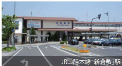
JR山陽本線「新倉敷」駅