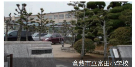
倉敷市立富田小学校

●倉敷市立富田小学校 (580m/徒歩8分) ●倉敷市立玉島北中学校 (1,170m/徒歩16分)