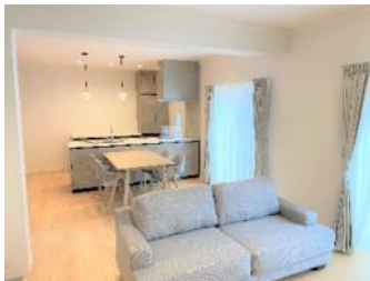
○写真撮影日: 2025年12月19日