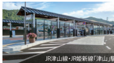
JR津山線・JR姫新線「津山」駅