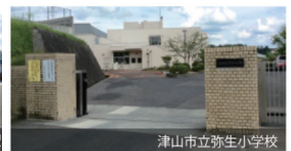
津山市立弥生小学校

【物件概要】●所在地/津山市上河原234番15●建築確認番号/第ERI-23007934(令和5年3月7日)●販売戸数/1戸●構造/木造2階建●間取り/3LDK●販売価格/39,980,000円(消費税10%込)●地目/宅地●用途地域/第二種中高層住居専用地域●都市計画/線引きされていない区域●建ぺい率/60%●容積率/200%●道路の幅員/北側6.0m(位置指定道路)※津山市へ帰属予定●指定道路築造承認番号/第RO4築承認津山市009号(令和4年8月18日)●主な設備/○電気：中国電力○ガス：津山ガス○水道：公営水道○雨水：側溝○排水：公共下水道●その他の制限/○第22条区域○津山市景観条例区域●建築年月日/2023年6月27日●取引態様/○建物：売主○土地：売主●備考/○まちなみガイドライン遵守のご協力をお願いします。○新設電柱の位置について買主は異議申し立てをしないこととします。