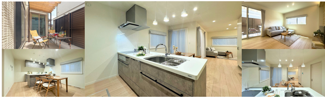
※上に記載の内観写真は全て2025/02/07に撮影したものです。