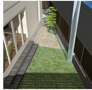
※画像は完成イメージパースです BBQやお子様のプールなど！