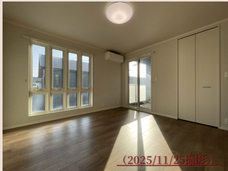
主寝室には バルコニー、WIC完備