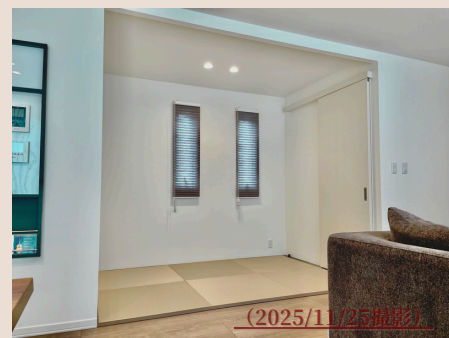
ファミクロ付き 畳コーナー