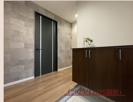
玄関はおしゃれなタイル調 落ち着いた家を出