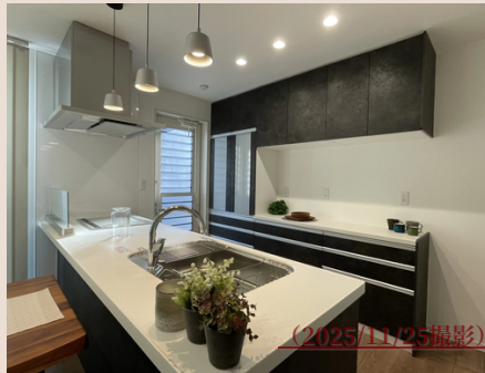
対面式のキッチンは 全自動食洗器付き！