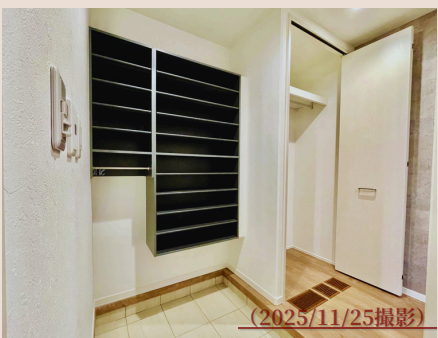
たっぷり収納・すっきり片付く 2WAY玄関