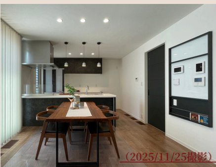
マグネット対応 リモコンニッチ