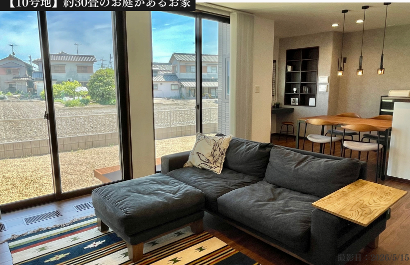
【10号地】約30畳のお庭があるお家

旧価格 公示日 2024/4/29 5,830 万円 (税込) -150 万円 新価格 公示日 2026/5/6 5,680 万円 (税込)