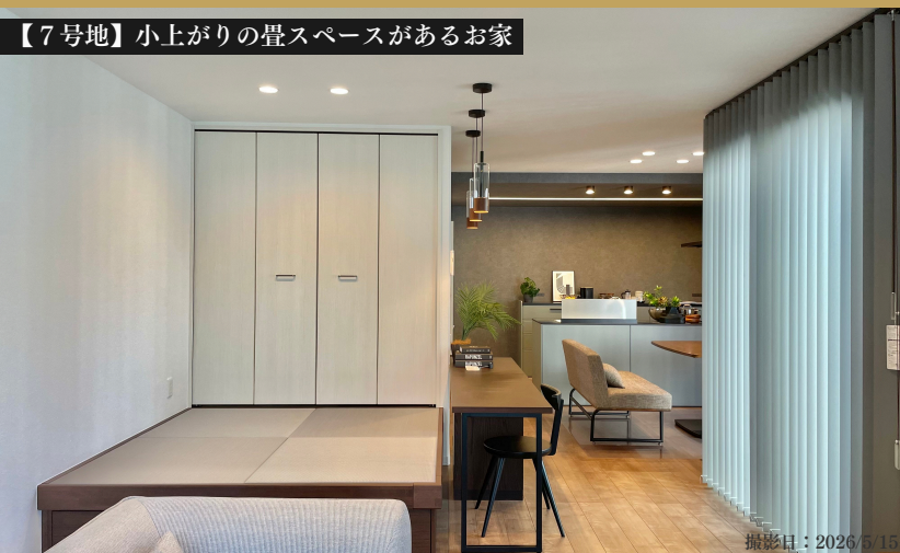
【7号地】小上がりの畳スペースがあるお家