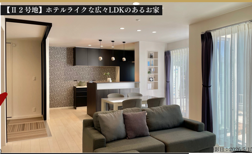
【II 2号地】ホテルライクな広々LDKのあるお家

旧価格 公示日 2026/2/5 5,260 万円 (税込) -80 万円 新価格 公示日 2026/6/28 5,180 万円 (税込)