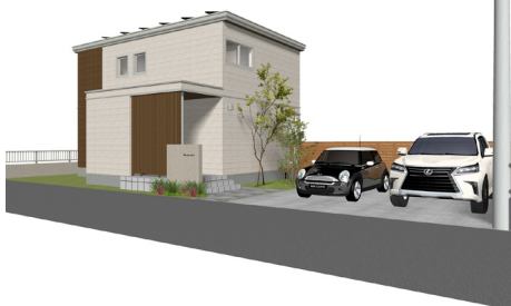
EXイメージパース図