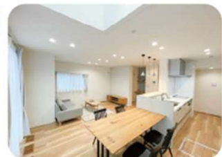
※写真は実際の内観写真です。(2024年8月30日撮影)

【物件概要】●所在地/鳥取市吉成南町1丁目640-10●販売戸数/1戸●構造/軽量鉄骨造2階建●間取り/3LDK●販売価格/44,480,000円(消費税10%込)●地目/宅地●交通/日ノ丸バス「市民体育館前」バス停600m(徒歩8分)●学校/鳥取市立美保南小学校850m(徒歩11分)、鳥取市立南中学校1,700m(徒歩22分)●都市計画/市街化区域●用途地域/第一種中高層住居専用地域●建ぺい率/60%●容積率/200%●道路の幅員/分譲地内6.0m(公道)※私道負担なし●主な設備/○電気:中国電力○水道:公営○雨水:側溝○汚水・雑排水:公共下水道●建築年月日/2023年10月6日●取引形態/○建物:売主○土地:売主●その他の制限/景観計画区域