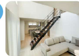
※写真は実際の内観写真です。(2025年4月29日撮影)

【物件概要】●所在地/鳥取市西品治772番19●販売戸数/1戸●構造/軽量鉄骨造2階建●間取り/3LDK●販売価格/55,500,000円(消費税10%込)●地目/宅地●交通/鳥取市コミュニティ「新茶屋」バス停120m(徒歩3分)●学校/鳥取市立富桑小学校580m(徒歩8分)、鳥取市立西中学校720m(徒歩10分)●都市計画/市街化区域●用途地域/第一種住居地域●地区/準防火地域●建ぺい率/60%●容積率/200%●道路の幅員/分譲地内4.0~6.0m(公道)、南西側6.0m(公道)●主な設備/○電気:中国電力○ガス:プロパンガス○水道:公営水道○雨水:側溝○排水:公共下水道●建築年月日/2025年4月14日●取引形態/○建物:売主○土地:売主