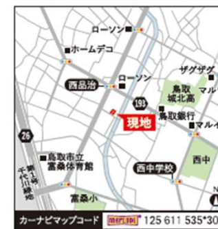
カーナビマップコード 125 611 535*30

※省エネ性能は https://www.816c.jp/archives/housing/housing-102116 でご確認いただけます