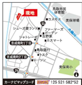
カーナビマップコード 125 521 582*52