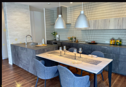
「kitchenhouse」Ⅱ型キッチン。 「アイカ」スマートサニタリー。 “邸宅にふさわしい、優雅な動線” “毎日が、ワンランク上の身支度”

住まいづくりに、確かな選択を。 妥協なき品質管理によって実現した上質な住空間。 大手メーカーだからこそ叶う、安心と美しさを兼ね備えた住まいを、 御幸町モデルハウスにてご覧いただけます。