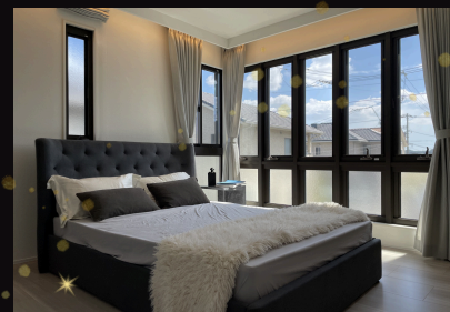
間接照明と窓の余白が迎える寝室。 “灯りは控えめに、窓は贅沢に”

WEBからご予約いただくと、 最大13,000円分 のQUOカードPayをプレゼント！