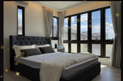
間接照明と窓の余白が迎える寝室。 “灯りは控えめに、窓は贅沢に”

WEBからご予約いただくと、 最大13,000円分 のQUOカードPayをプレゼント！