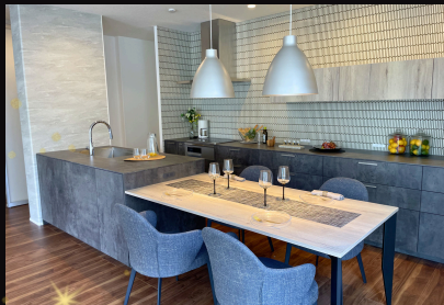
「kitchenhouse」II型キッチン。 「アイカ」スマートサニタリー。 “邸宅にふさわしい、優雅な動線” “毎日が、ワンランク上の身支度”

住まいづくりに、確かな選択を。 妥協なき品質管理によって実現した上質な住空間。 大手メーカーだからこそ叶う、安心と美しさを兼ね備えた住まいを、 御幸町モデルハウスにてご覧いただけます。