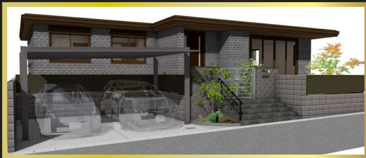
完成予想外観パース