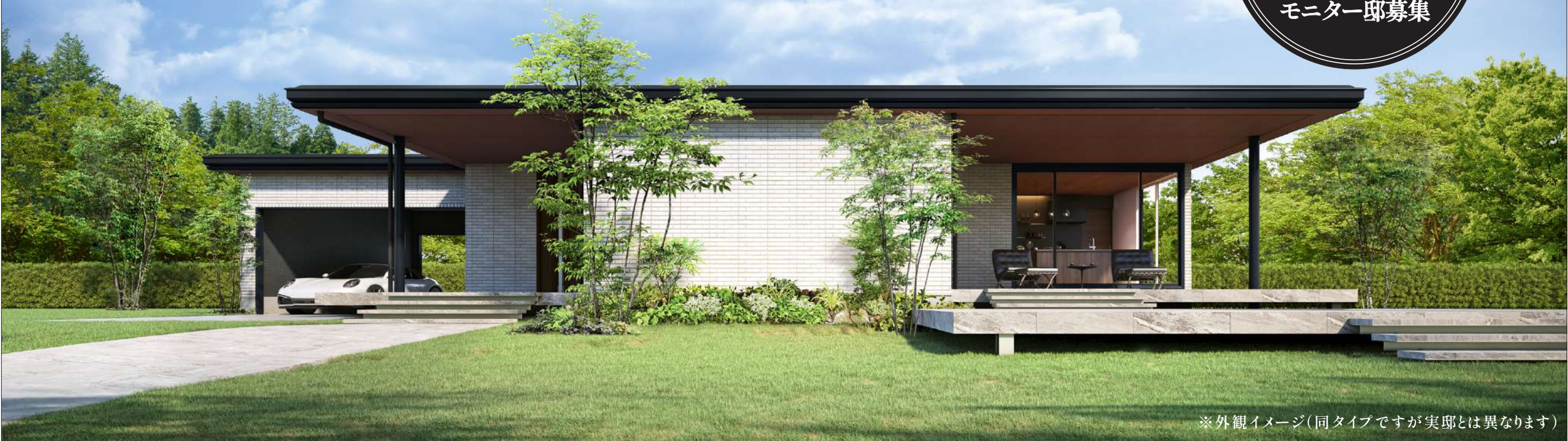
※外観イメージ(同タイプですが実邸とは異なります)