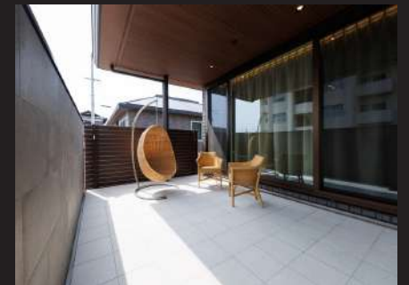
うちもとテラスイメージ