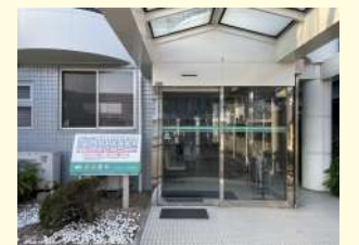
永谷眼科 / 430m