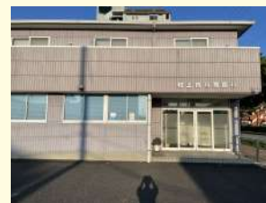
村上内科胃腸科 / 320m