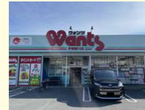
ウオンツ宇部新川店 / 630m