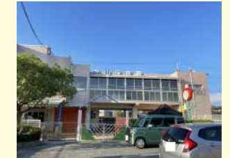
桃山保育園 / 280m