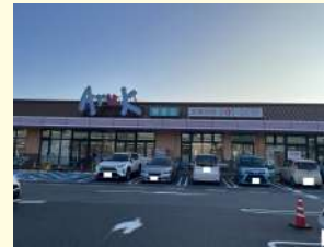
アルク琴芝店 / 1,300m