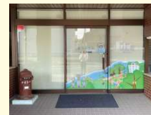
金子小児科 / 1,000m