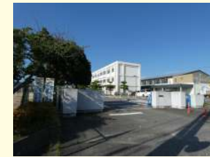
新川小学校 / 360m