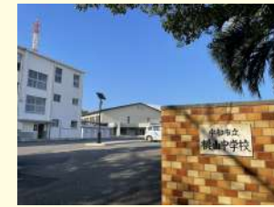
桃山中学校 / 1,540m