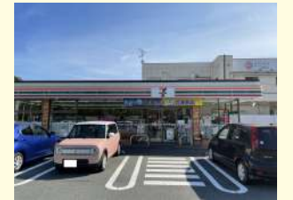
セブンイレブン宇部島2丁目店 / 280m