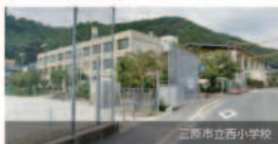
三原市立西小学校