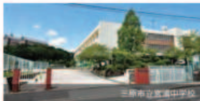
三原市立宮浦中学校