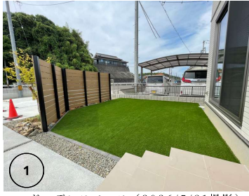
ガーデンスペース (2026/5/31撮影)