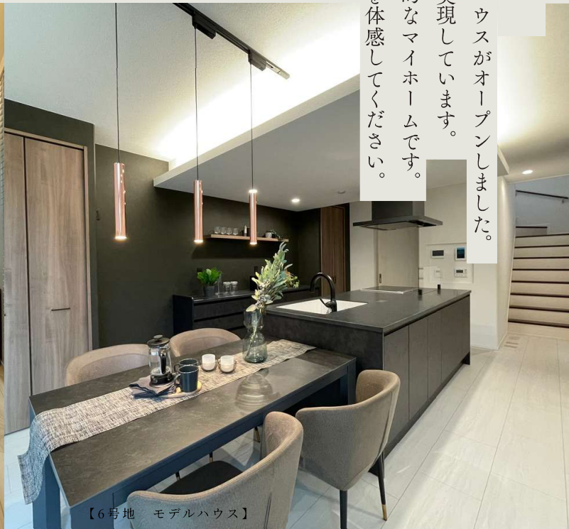
【6号地 モデルハウス】