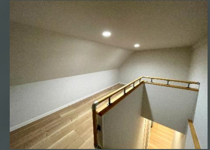
内観・外観撮影：2026年5月16日