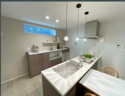
内観・外観撮影 ：2026年6月20日