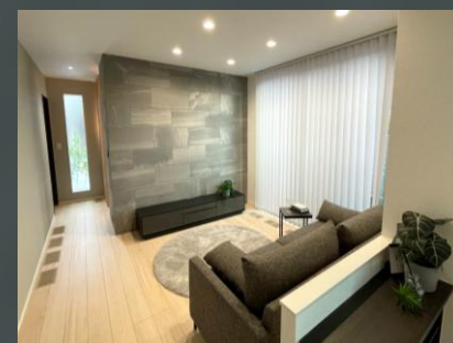
内観・外観撮影 ：2026年6月20日