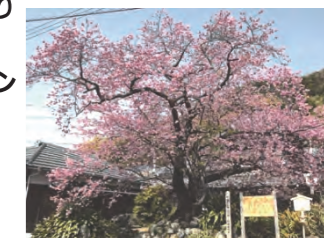
静岡県河津町にある河津桜の原木

オオシマサクラ系とカンヒサクラ系の自然交配種と推定され、ソメイヨシノより一ヶ月ほど早く咲き始めます。気温の変化で開いたり閉じたりを繰り返しながら、約一ヶ月にわたって咲きます。色は濃いピンクで落葉高木、大きな花びらの桜です。※ 岡山の気候では3月初旬より約一か月間開花します。