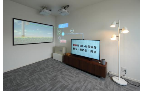
▲スマートハイムルーム

停電体験を通じ、太陽光発電システムと蓄電池が停電時に発揮する効果をご紹介します。災害時における「在宅避難」が可能な住まいをご提案します。