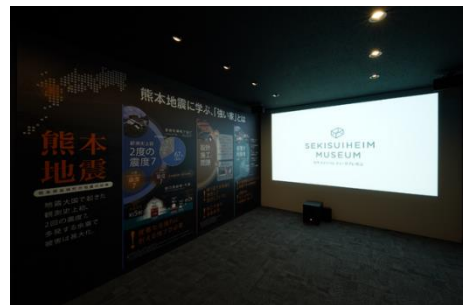
▲巨大地震体感シアター

住宅を建築する際の注意点を、雨天日や湿気が多い山陰エリアならではの視点から、AR 技術を用いスマートフォンやタブレットで効果的に解説します。建築現場を再現した模型にタブレットをかざすと、悪天候時の建築現場を見ることができます。現場施工が抱える課題についてわかりやすくお伝えします。